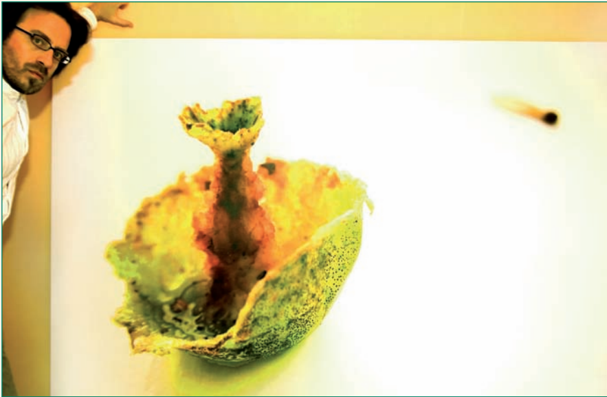
Caiuco, fame e inmigración / Xacobe Meléndrez

teño en fase de produción o da auga coa exposición "Memoria auga" e unha videoinstalación en espazos públicos "Enriba da pegada humana-Over human track" na que xogo con este elemento e co concepto de ruína. Estes están á espera de patrocinio, xa que me gustaría telos listos coincidindo coa ExpoZaragoza 2008.