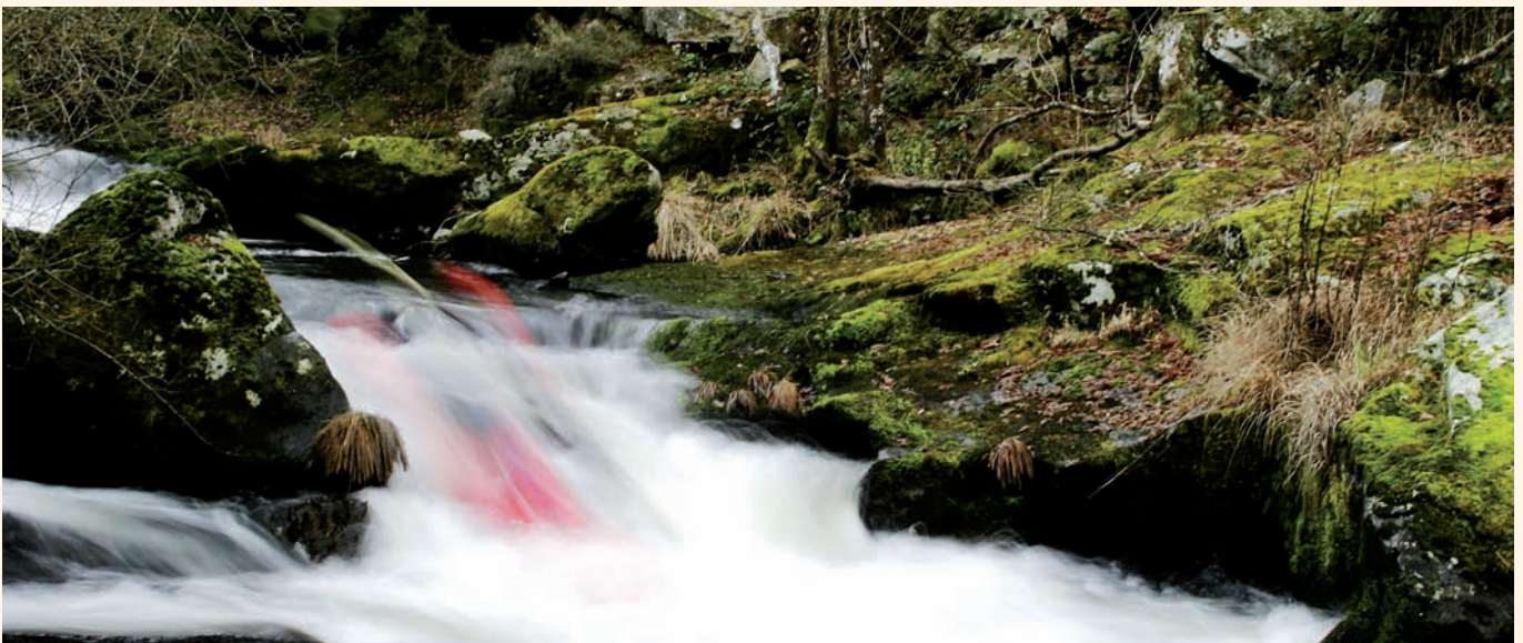
Memoria Auga / Xacobe Meléndrez